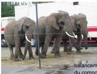
balancements révélateurs de troubles du comportement dus au stress

• La fuite : lions (Bas-Rhin 2000, Marseille 2002), hippopotames (Ile de France 2000, Somme 2004), éléphants (Lyon 2000), macaque (Bouches-du-Rhône 1999), tigres (Paris 1999, Nantes 2000), zèbres (Tarn 2009), etc.